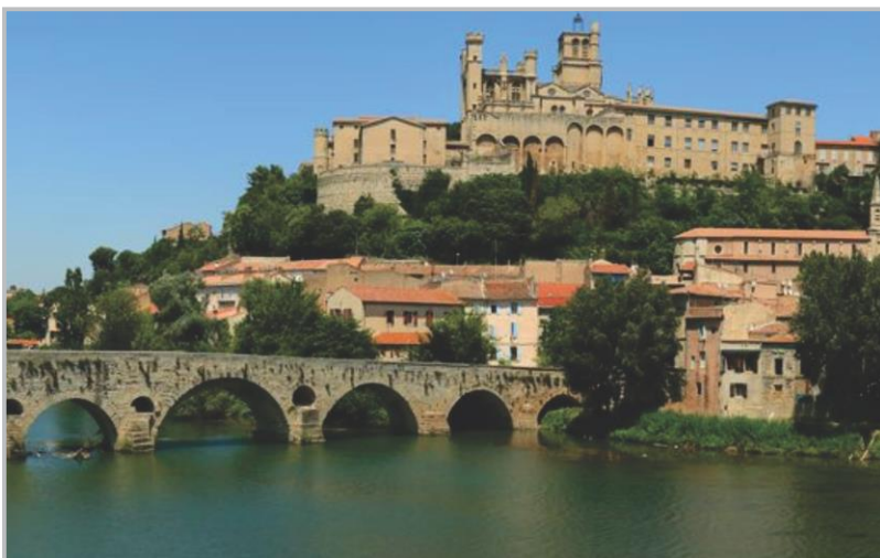
Béziers - Sul da França

«A sua vida não foi uma linha reta feita de facilidades, mas sempre colocou em Deus o norte da sua existência». Foi uma vida toda entregue a Deus, cuidando das crianças órfãs, das mulheres prostituídas, das jovens estudantes, protegendo os que se encontravam à margem da vida, «amando a Deus e fazendo-O amado», lutando para que todos tivessem «vida em abundância».