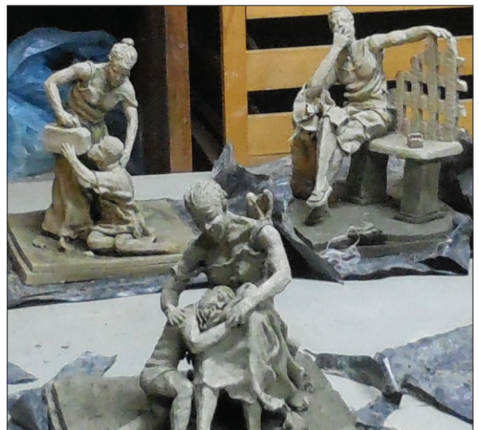
Hermosa artesanía en arcilla creada por un inmigrante de Nigeria.

En el número 634, Ise ofrece vecindario una variedad de posibilidades y oportunidades. Se dictan clases de italiano, inglés y tecnología informática. Cuando hicimos la visita, había más de 50 personas inscritas en el curso para el registro de conducción. Se enseña corte y confección y se aceptan pedidos de preparación de vestidos y uniformes para actuaciones. Uno de los inmigrantes es un artista excepcionalmente dotado que enseña a alumnos, algunos de los cuales de escuelas superiores, a trabajar con la arcilla.