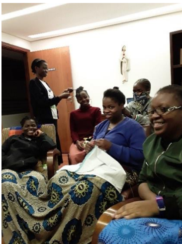
Recreação numa noite fria.

Curtindo a vida com uma ao outra noviciado!